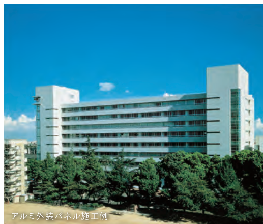
アルミ外装パネル施工例