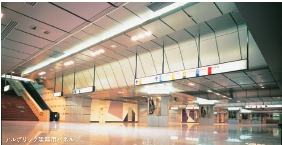
アルポリック建築用パネル