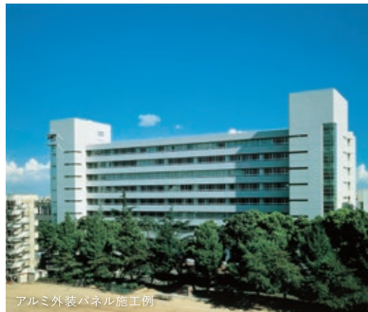
アルミ外装パネル施工例