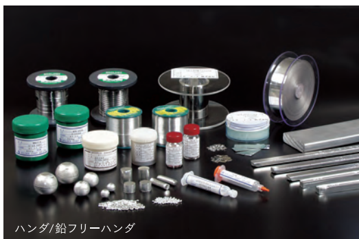
ハンダ/鉛フリーハンダ