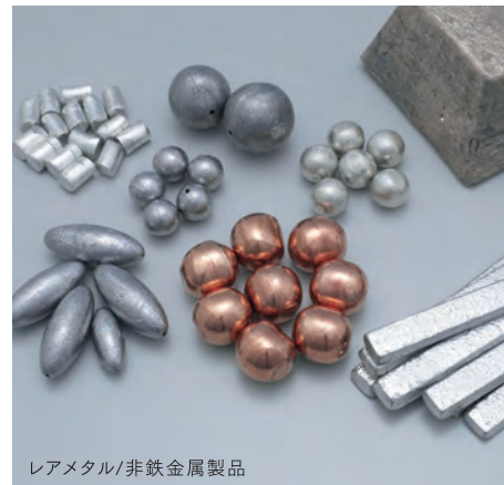
レアメタル/非鉄金属製品