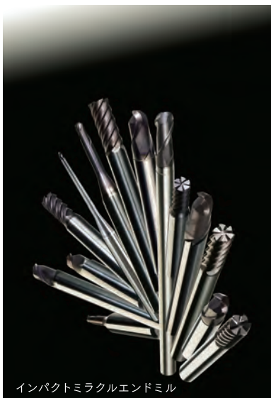
インパクトミラクルエンドミル

FA Machinery and Tools/ Carbide Tools/ Grinding Tools/ Wear and impact-resistant Tools