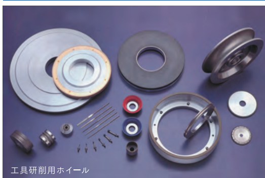
工具研削用ホイール