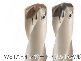
WSTARインサードリルTAW形