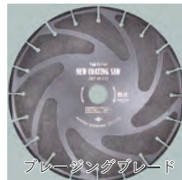
ブレードングブレード