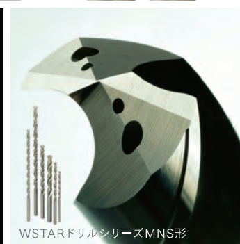
WSTARドリルシリーズMNS形