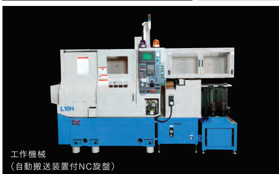
工作機械 (自動搬送装置付NC旋盤)