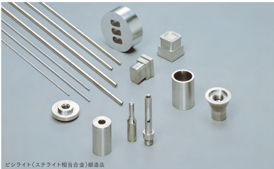
ピンライト(ステライト相当合金)鍛造品

Precision Castings, Precision Forgings/ Copper Alloys